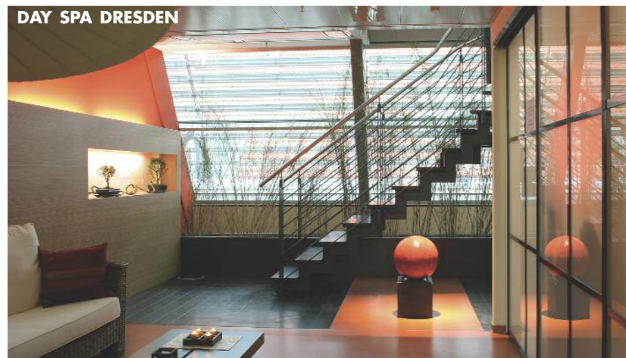
DAY SPA DRESDEN

DAY SPA, DRESDEN Ob orientalische Körperbehandlungen, Shiatsu, Yoga oder innovative Gesichtspflege – das liebevoll geführte Day Spa am Altmarkt zaubert passionierte Wellnessliebhaber garantiert in den siebten Wohlfühl-Himmel. Dr.-Külz-Ring 15, 01067 Dresden, www.dayspa-am-altmarkt.de