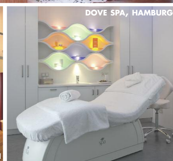
DOVE SPA, HAMBURG

DOVE SPA, HAMBURG Ob trockene, anspruchsvolle oder empfindliche Haut – nach einer ausführlichen Hautanalyse verwöhnen die charmanten Dove Spa Expertinnen die Gesichts- und Körperpartien mit der eigens entwickelten Produktlinie, die keine Wünsche mehr offen lässt. Großer Grasbrook 16, 20457 Hamburg, Tel. 0 40-34 93 13 55, www.dovespa.de