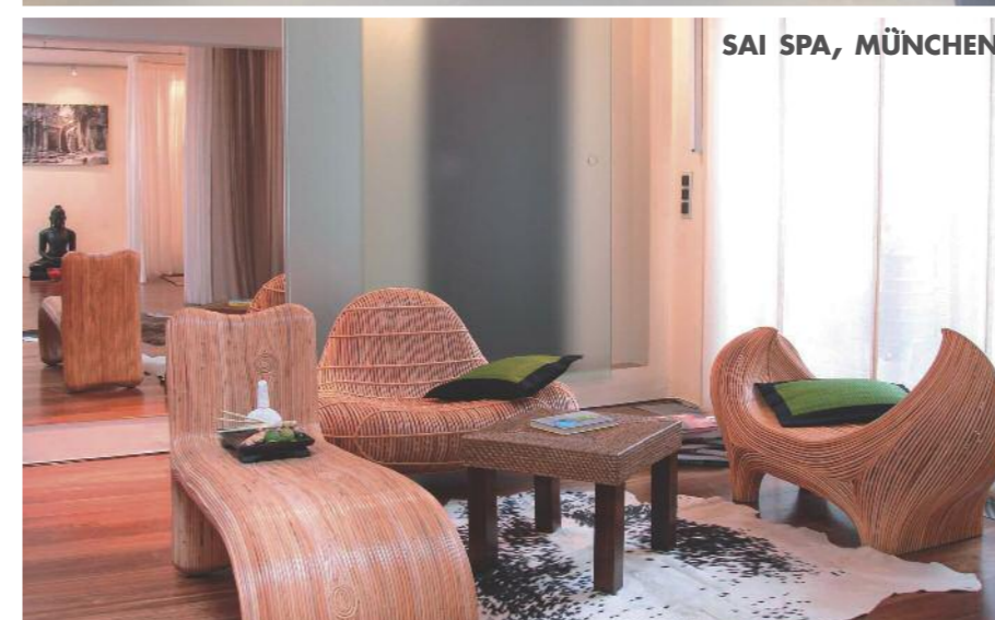
SAI SPA, MÜNCHEN

NIVEA HAUS, BERLIN Wer sich nach einem ausgedehnten Shopping- oder Sightseeingtrip eine besondere Auszeit wünscht, der sollte dem NIVEA Haus unbedingt einen Besuch abstatten. Hier tanken erschöpfte Hauptstädter und Touristen bei einer wohltuenden Massage oder einem typgerechten Make-up neue Energie. Unter den Linden 28 (in den Kaiserhöfen), 10117 Berlin, Tel. 0 30-20 45 61 60