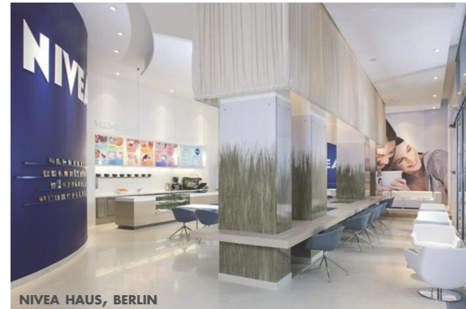
NIVEA HAUS, BERLIN

NIVEA HAUS, BERLIN Wer sich nach einem ausgedehnten Shopping- oder Sightseeingtrip eine besondere Auszeit wünscht, der sollte dem NIVEA Haus unbedingt einen Besuch abstatten. Hier tanken erschöpfte Hauptstädter und Touristen bei einer wohltuenden Massage oder einem typgerechten Make-up neue Energie. Unter den Linden 28 (in den Kaiserhöfen), 10117 Berlin, Tel. 0 30-20 45 61 60