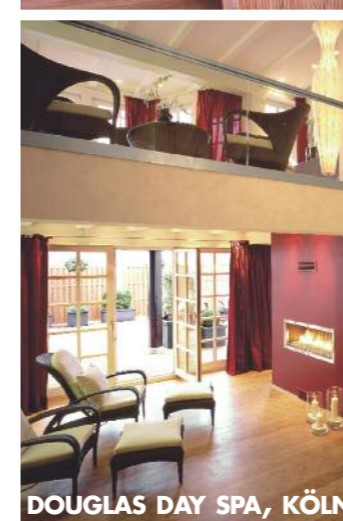
DOUGLAS DAY SPA, KÖLN

DOUGLAS DAY SPA, KÖLN Rund 270 Quadratmeter laden zu Wellness-Massagen, Ayurvedischen Treatments, Aromatherapie und klassischen Gesichtsbearbeitungen ein. Das ganzheitliche Konzept basiert auf den sieben Säulen des menschlichen Wohlbefindens. Schildergasse 39, 50667 Köln, Tel. 02 21-9 20 86 23, www.spa-douglas.de